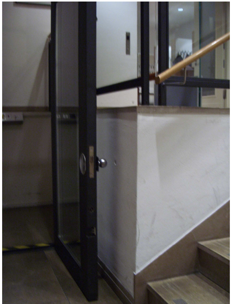
Berggruen Museum im Stülerbau, Berlin, Treppenlift